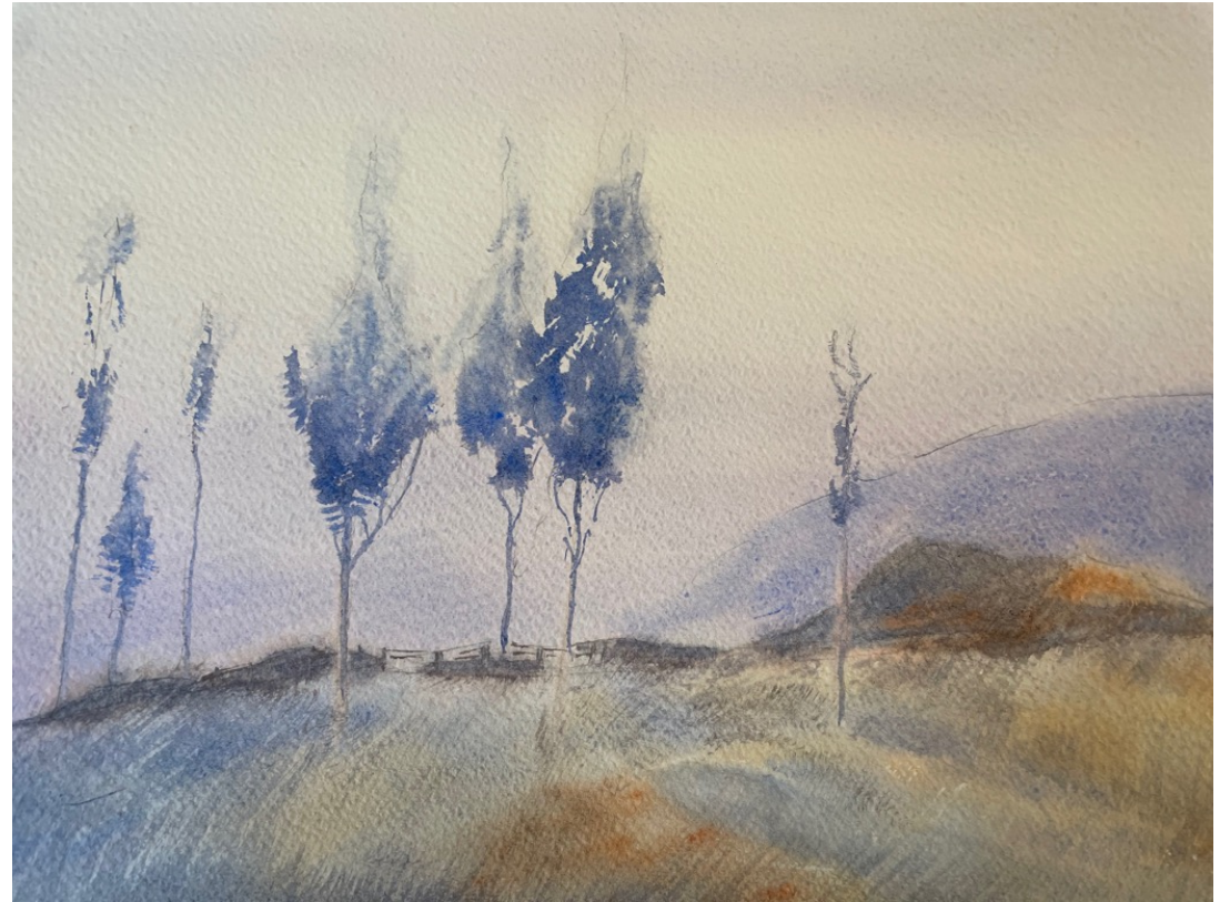
Travail dans l'humide