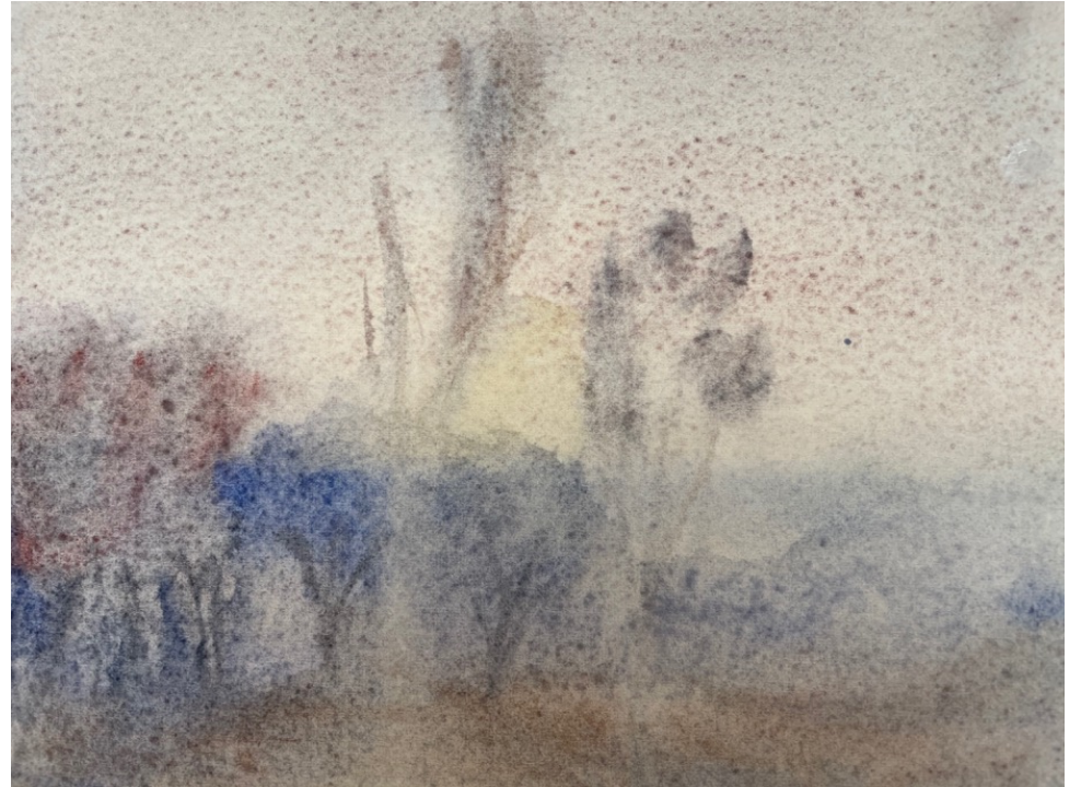
Couleurs granuleuses et gris colorés