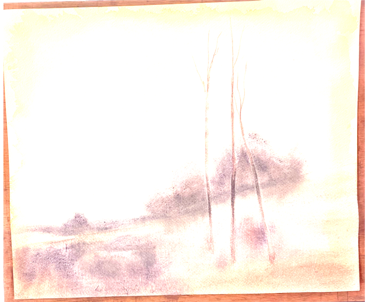
lavis de jaune en sous couche